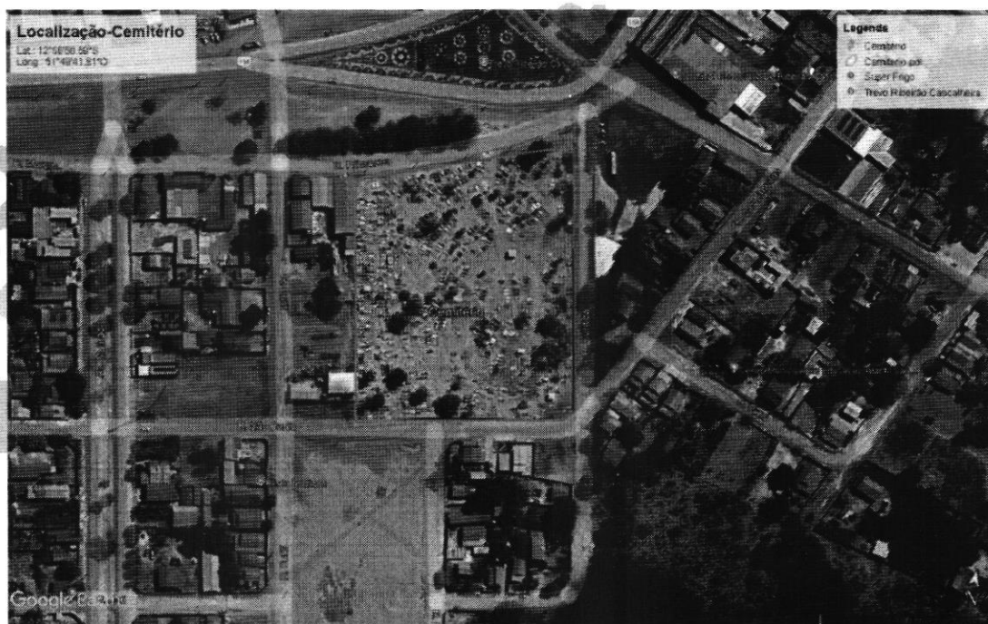
Fig. 1 – Localização